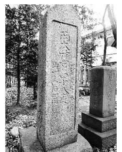
伊勢神宮・善光寺 四十八度詣碑