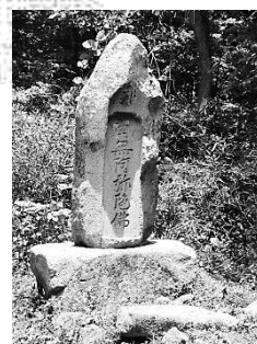
等順名号碑 善光寺別当等順の足跡