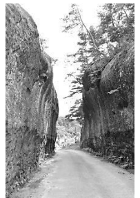
青柳の切通し 百体観音跡