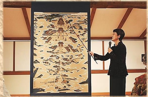
「善光寺参り絵解き図」