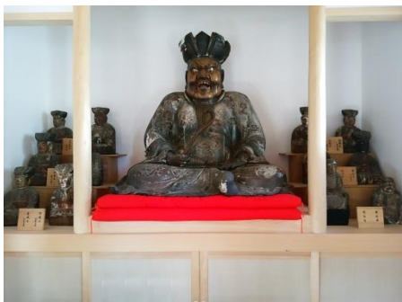
東の十王堂 城下町四方の出入口には十王堂があった。